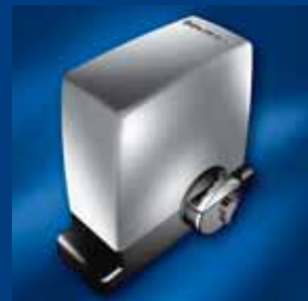
tousek Schiebetorantriebe kompakt und sicher