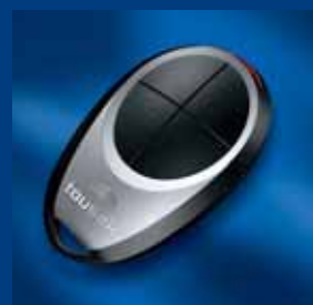
tousek Impulsgeberprogramm kompatibel und sicher