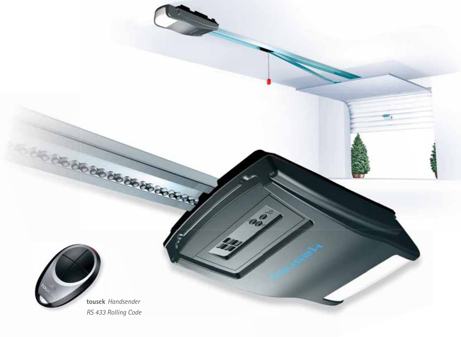
tousek Handsender RS 433 Rolling Code