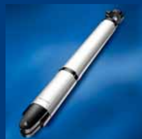
tousek Drehtorantriebe rationell und stark