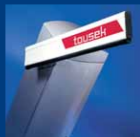
tousek Schrankensysteme formschön und robust