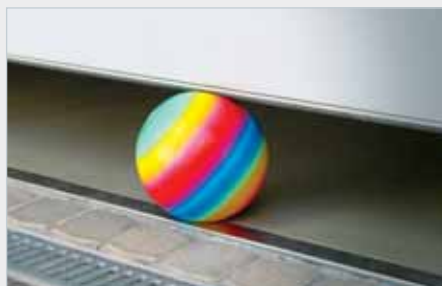
Alle Antriebe der TT-Serie sind mit den automatischen Sicherheitssystemen ASS bzw. ARS ausgerüstet.

Tore mit vertikaler Führung benötigen zusätzlich den tousek Kurvenarm ⑦, 2-flügelige, nach außen aufgehende Flügeltore (bis max. 1,4m Flügelbreite), einen Flügeltorbeschlag ⑧ um einen korrekten Bewegungsablauf zu ermöglichen. Für leichte bis mittelschwere Tore empfehlen wir den besonders schnellen Antrieb tousek TT60. Der mit einem leistungsstärkeren Motor ausgerüstete tousek TT120 wurde für schwere Tore entwickelt.