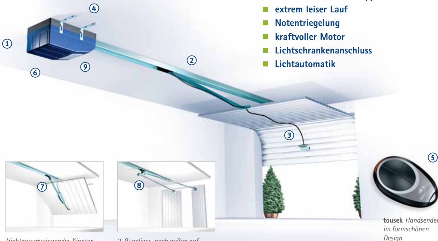
Nichtausschwingendes Kipptor mit dem tousek Kurvenarm